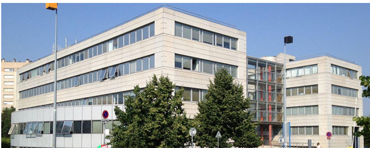
La maison René Ginouvès sur le campus de Nanterre

L'objectif premier du rassemblement de différents laboratoires à la MAE est l'échange entre chercheurs dont les disciplines sont très liées. Un colloque inter-laboratoires est organisé chaque année et le prix de thèse de la MAE récompense tous les deux ans les jeunes docteurs de ces différentes UMR. Enfin, chaque année la MAE met à l'honneur ses jeunes docteurs en organisant une cérémonie qui leur est dédiée.