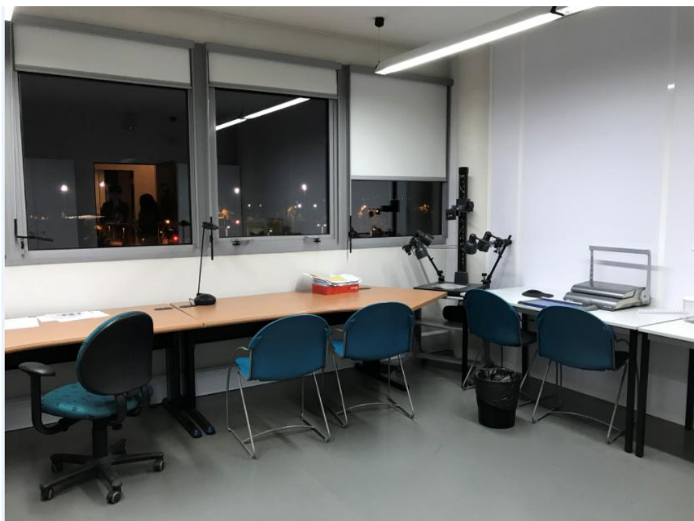
La salle 222D de la maison René Ginouvès

Veillez noter que vous avez accès à des banques d'articles en ligne (type JSTOR) via vos universités. ArScAn ne fournit pas d'accès à ces banques.