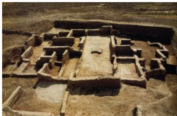
Kheit Qasim III : Habitation tripartite, un modèle

L'équipe dirigée par Jean-Daniel Forest, a dégagé sur un petit site du 5 e millénaire, Kheit Qasim III, une habitation et un bâtiment communautaire, qui ont renouvelé profondément la connaissance de l'Obeid du Nord et ont montré notamment, en même temps que les fouilles anglaises de Tell Madhhur, que le plan tripartite n'était nullement propre aux édifices religieux ou prétendus tels.