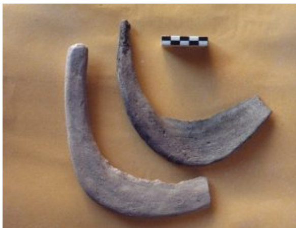
Faucilles en terre cuite