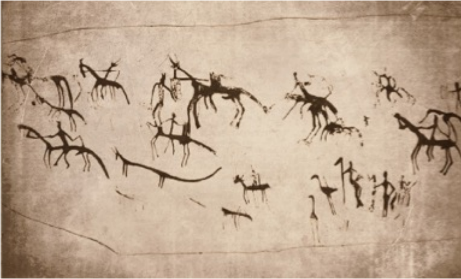
Gravures rupestres de Pobe-Mengao (Nord du Burkina Faso – Relevé de Yves SANOU).