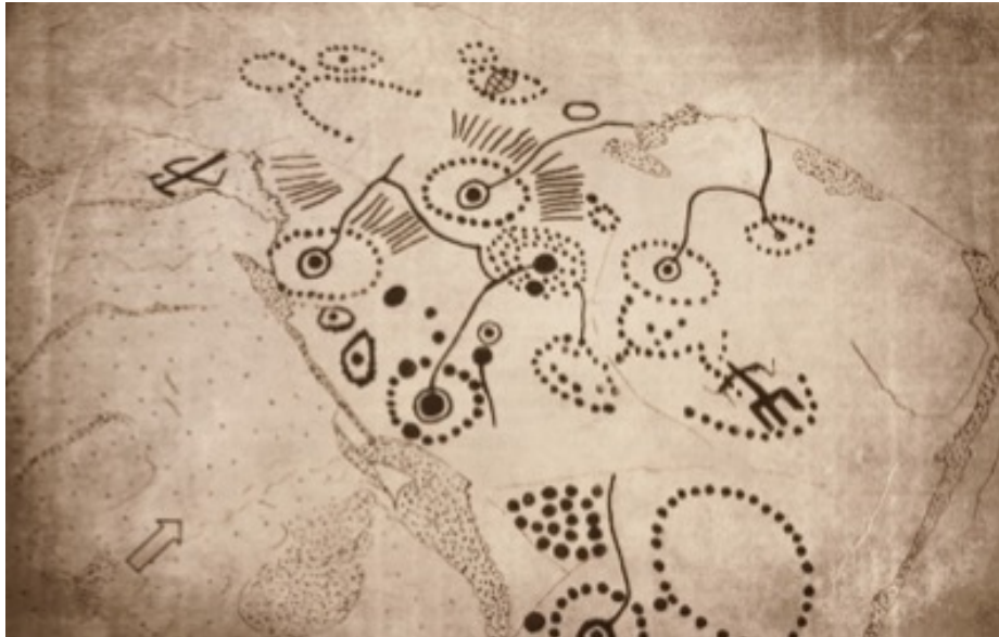
Gravures rupestres de Toussiana (Ouest du Burkina Faso – Relevé de Yves SANOU)