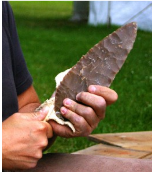
Façonnage d'une pointe foliacée du Solutréen