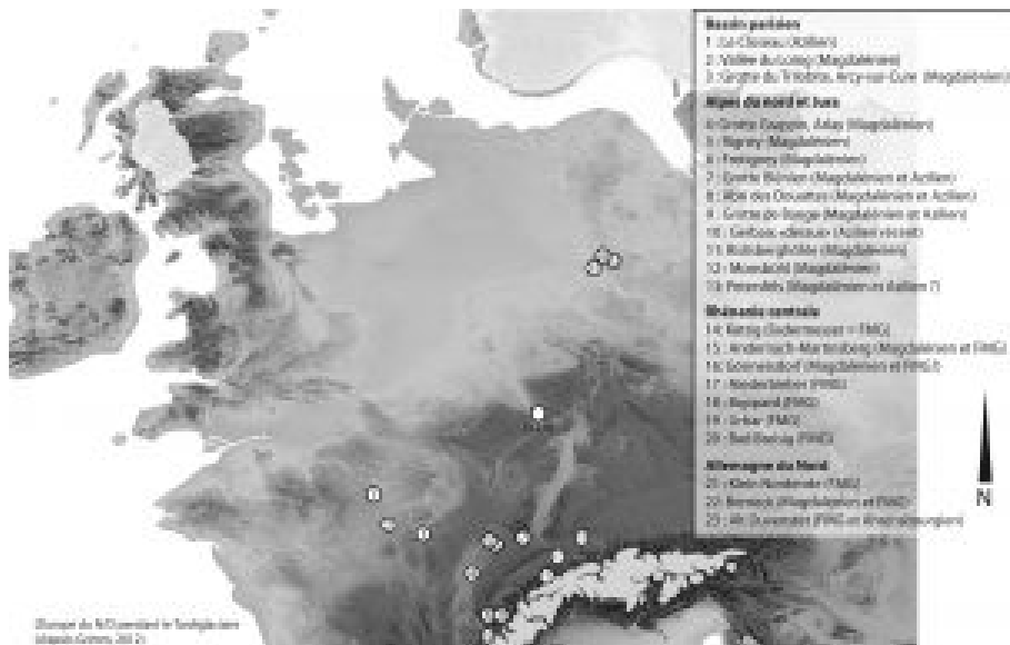
Carte des régions concernées par le projet de recherche et localisation des principaux gisements cités (carte : d'après Grimm, 2012)