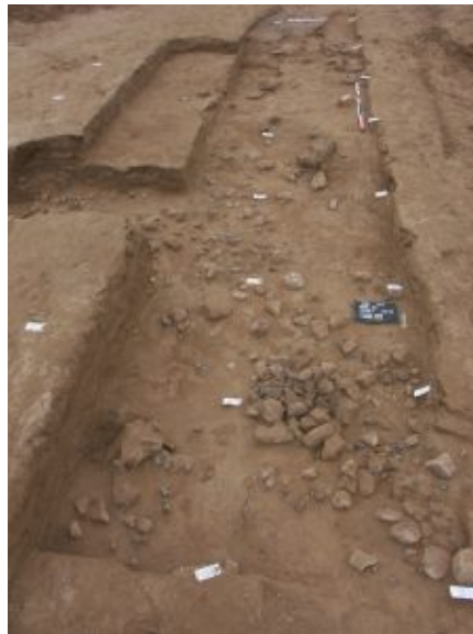
Niveau de sol et foyer du Magdalénien inférieur à Mareuil-sur-Cher (41).