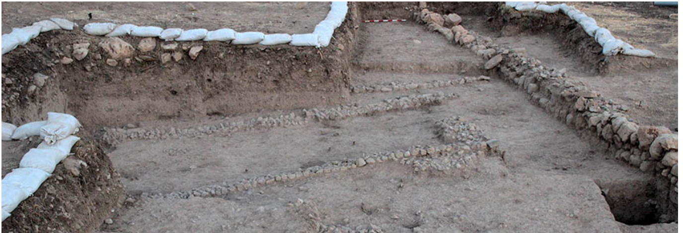
Structures d'habitat du Néolithique précéramique à Beisamoun (7 ème millénaire cal BC)

Mots clés : Néolithique précéramique B et C, dynamisme culturelle, micro-histoire.