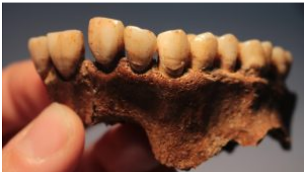
Hypoplasie de l'émail dentaire et tartre chez un individu natoufien de la grotte de Raqefet