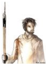
Volume 1 : Texte

Thèse présentée en 2014 pour obtenir le grade de Docteur en Préhistoire, Ethnologie et Archéologie