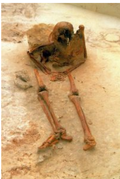
Sépulture en position assise datée du Mésolithique moyen

Une enquête étendue à une bonne partie de l'Europe permet de recenser plus d'une centaine d'autres sites mésoolithiques livrant des structures analogues, parfois en grand nombre. Il en ressort une image très éloignée de la vision traditionnelle de ces sociétés (cf. chasseurs-collecteurs très mobiles aux campements temporaires sommairement aménagés).