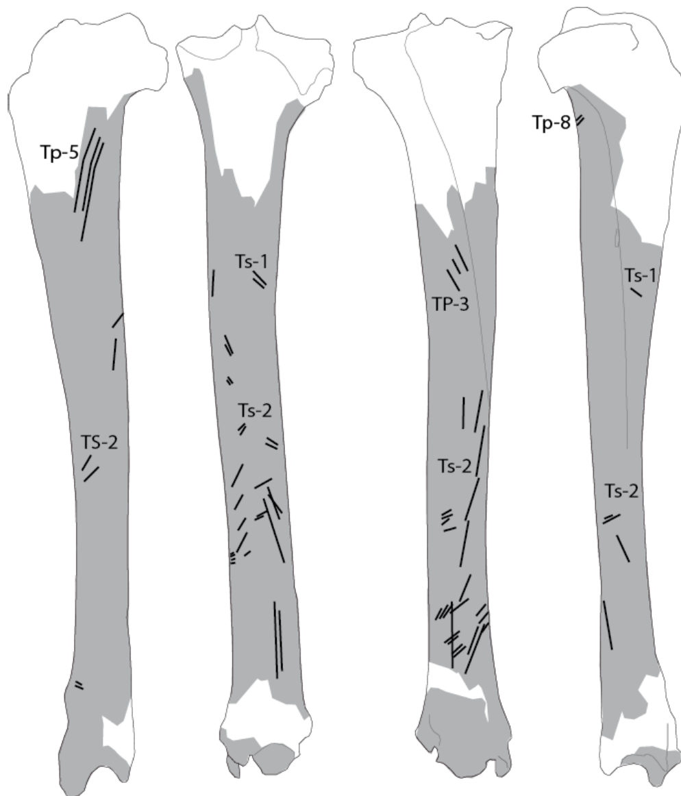
Exemple de report de stries de boucherie (codage d'après Costamagno, 2012 et Soulier, 2013)